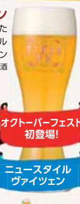
オクトーバーフェスト 初登場!

ヴァイツェン 鮮度抜群!フルーティで 華やかな香りのビール 提供:富士桜高原麦酒