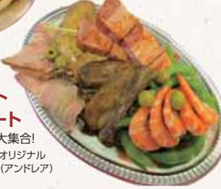
※写真はメニューの一部です。

オクトーバーフェスト プレート 人気のメニューが大集合! 提供:オクトーバーフェストオリジナル ソーセージ&ビール(アンドレア)