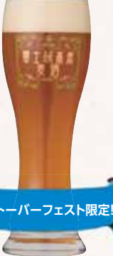
オクトーバーフェスト限定!

オクトーバーフェストヴァイツェン フルーティな香り カラメルモルト風味 提供:富士桜高原麦酒