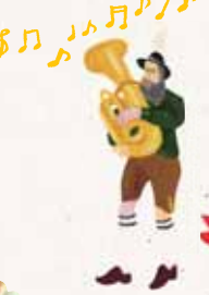
オクトーバーフェスト 初登場!

ジャーマンプレート 自社自慢のソーセージの 豪華盛り合わせのお得なセット 提供:オクトーバーフェストオリジナル ソーセージ&ビール(アンドレア)