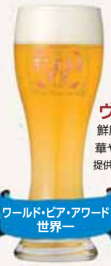
ワールド・ビア・アワード 世界一

サマーヴァイツェン 柑橘系ホップを使用した さわやかなニュースタイル ヴァイツェン 提供:富士桜高原麦酒