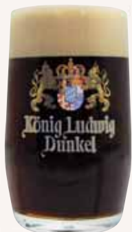
ワールド・ビア・アワード 金賞受賞

ケーニッヒ・ルードヴィッヒ ドンケル バイエルン王家のドンケル