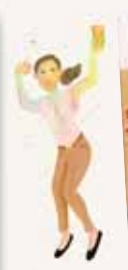
オクトーバーフェスト 初登場!

ゾラホフ・ヴァイツェンヘル 世界のシェフ・ソムリエが選んだ 歴史的三ツ星ヴァイスビア 提供:オクトーバーフェストオリジナル ソーセージ&ビール(アンドレア)