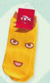
优马塔西袜子 500日元