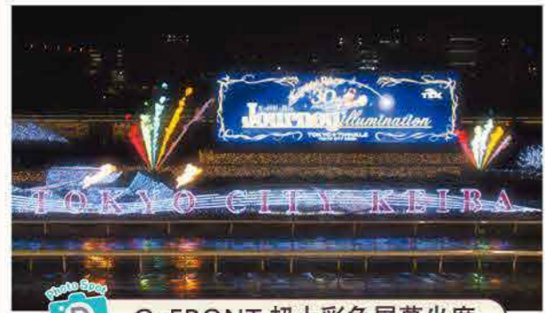
D G-FRONT 超大彩色屏幕坐席