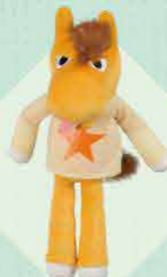
优马塔西布偶 2,400日元