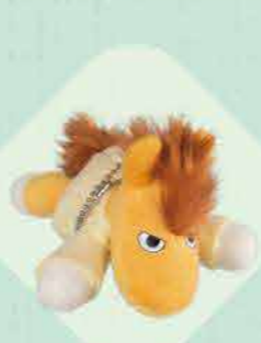
懒洋洋的优马塔西 700日元