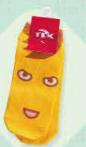
优马塔西袜子 500日元