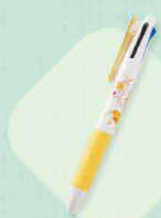
优马塔西圆珠笔 334日元