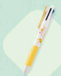
优马塔西圆珠笔 334日元