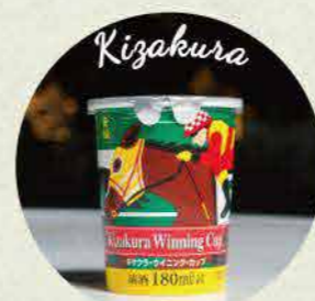
日本酒 (黄樱, 胜利杯) 450日元