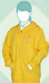
优马塔西外套 3,000日元