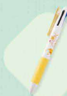
优马塔西圆珠笔 334日元