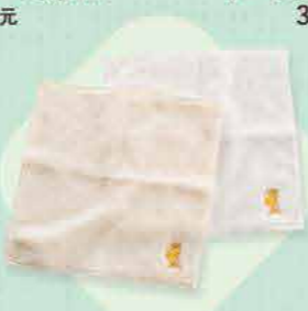
优马塔西今治毛巾(白色、奶油色) 各600日元